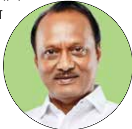
अजित पवार उपमुख्यमंत्री

राज्यातील कोरोना संसर्गाची साखळी तोडण्यासाठी कोरोनाबाधित रुग्णांच्या गृहविलगीकरणाऐवजी संस्थात्मक विलगीकरणावर भर देताना कोरोनाबाधितांच्या संपर्कात असणाऱ्या हाय-रिस्क, लो-रिस्क व्यक्तींच्या कोरोना चाचणीवर भर द्यावा. महात्मा जोतिराव फुले जनआरोग्य योजनेतर्गत म्युकरमायकोसिस आजारवर मोफत उपचार करणाऱ्या १३१ रुग्णालयांची यादी प्रसिद्ध करावी. कोरोना लढ्याला बळ देण्यासाठी १५व्या वित्त आयोगातील २५ टक्के निधी तसेच गौण खनिज निधीतील रक्कम आरोग्यावरील खर्चासाठी मंजुरी देत राज्यातील रुग्णालयांचे ऑक्सिजन, इलेक्ट्रिक, फायर ऑडिट तातडीने करण्याचे निर्देश उपमुख्यमंत्री अजित पवार यांनी दिले.