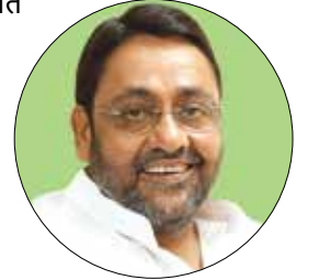
नवाब मलिक कौशल्य विकास, रोजगार व उद्योजकता, अल्पसंख्याक विकास व औकाफ मंत्री

साथीच्या रोगाशी संबंधित उद्भवलेल्या परिस्थितीत आरोग्य व वैद्यकीय क्षेत्राला कुशल मनुष्यबळ उपलब्ध व्हावे यासाठी राज्यातील आरोग्य क्षेत्रात काम करण्यास इच्छुक असलेल्या युवक-युवतींना हेल्थकेअर, मेडिकल, नर्सिंग व डोमेस्टिक हेल्थकेअर वर्कर क्षेत्रामध्ये कौशल्य विकास प्रशिक्षण देण्यात येणार आहे. यासाठी प्रमोद महाजन कौशल्य व उद्योजकता विकास अभियानांतर्गत 'मुख्यमंत्री महाआरोग्य कौशल्य विकास प्रशिक्षण कार्यक्रम' राबवण्यात येणार असून, यामधून २० हजार युवक-युवतींना प्रशिक्षण दिले जाईल, अशी माहिती कौशल्य विकास, रोजगार आणि उद्योजकता मंत्री नवाब मलिक यांनी दिली. या संदर्भातील सविस्तर शासन निर्णय निर्गमित करण्यात आला आहे.