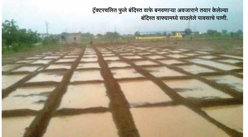
ट्रॅक्टरचलित फुले बंदिस्त वाफे बनवणाऱ्या अवजाराने तयार केलेल्या बंदिस्त वाफ्यामध्ये साठलेले पावसाचे पाणी.

ही बाब विचारात घेऊन महात्मा फुले कृषी विद्यापीठ, राहुरी अंतर्गत अखिल भारतीय समन्वयित कृषी अवजारे व यंत्रे संशोधन प्रकल्प, म.फु.कृ.वि., राहुरी यांनी 'ट्रॅक्टरचलित फुले बंदिस्त वाफे बनवणारे अवजार' विकसित केले आहे. या यंत्राने ६ मीटर लांबीचे व २ मीटर रुंदीचे बंदिस्त वाफे तयार करता येतात. वाफ्याच्या वरंब्याची उंची साधारणपणे २० ते २२ सें.मी. राहते. या यंत्राच्या साहाय्याने तयार होणाऱ्या बंदिस्त वाफ्यामुळे शेतात पडणारे पावसाचे पाणी ज्या ठिकाणी पडते त्याच ठिकाणी मुरवले जाते. त्यामुळे जमिनीमध्ये ५० टक्के जास्त ओल साठवली जाते. बंदिस्त वाफे तयार करणे हे मृदू व जलसंधारण पद्धतीपैकी एक आहे आणि त्यामुळे पावसाचे