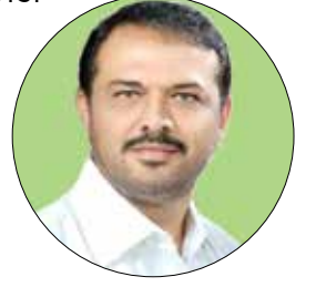
सुनील केदार पशुसंवर्धन व दुग्धव्यवसाय विकास, क्रीडा व युवक कल्याण मंत्री