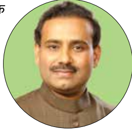
राजेश टोपे सार्वजनिक आरोग्य व कुटुंब कल्याण मंत्री

या संदर्भात माहिती देताना आरोग्यमंत्री श्री. टोपे म्हणाले, राज्यात दिवसेंदिवस कोरोना रुग्णांची संख्या वाढत आहे. त्याचबरोबर तिसऱ्या लाटेबाबत वर्तवलेल्या अंदाजामुळे रुग्णसेवेसाठी अधिक मनुष्यबळाची गरज आहे. सध्या रुग्णसेवेशी निगडित ५० टक्के पदभरतीला मान्यता होती. मात्र वाढत असलेले कोरोनाचे रुग्ण पाहता १०० टक्के पदभरतीला मान्यता देण्याबाबत आग्रहपूर्वक मागणी मंत्रिमंडळाच्या बैठकीत करण्यात आली. त्याला मान्यता देतानाच मुख्यमंत्री, उपमुख्यमंत्री आणि आरोग्यमंत्री यांच्या स्तरावर पदभरतीचा निर्णय घेण्याला मंजुरी देण्यात आल्याचे श्री. टोपे यांनी सांगितले.