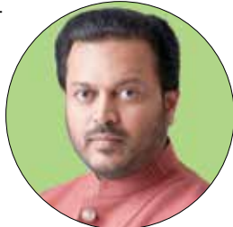
अमित देशमुख वैद्यकीय शिक्षण, सांस्कृतिक कार्य मंत्री

कोरोना काळात आर्थिक संकटात सापडलेल्या राज्यातील कलावंतांच्या पाठीशी शासन ठामपणे उभे असून, कलाकारांना शासनाकडून सर्वतोपरी मदत करण्यात येईल. त्यासाठी सांस्कृतिक कार्य विभागाने ताबडतोब प्रस्ताव सादर करावेत, अशा सूचना सांस्कृतिक कार्य मंत्री अमित विलासराव देशमुख यांनी दिल्या. सांस्कृतिक कार्य विभागातील अधिकार्यांच्या, दूरदृष्य प्रणालीद्वारे आयोजित बैठकीत ते बोलत होते.