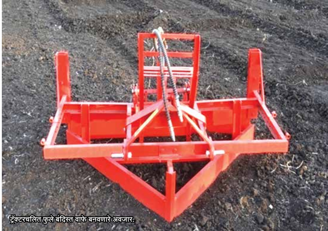
ट्रॅक्टरचलित फुले बंदिस्त वाफे बनवणारे अवजार.

प्रभावीपणे तसेच सर्व क्षेत्रावर समप्रमाणात साधने शक्य होते. जमिनीत ओलावा दीर्घकाळ टिकून पिकाच्या संवेदनशील अवस्थेत उपयोगात येऊन मूलस्थानी जलसंधारण पद्धतीवर घेतलेले उत्पादन २० ते २५ टक्के अधिक मिळते. कोरडवाहू शेती ही नेहमी एकूण पडणाऱ्या पावसावर अवलंबून नसून ती पडणाऱ्या पावसाच्या