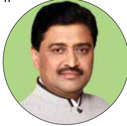
अशोक चव्हाण सार्वजनिक बांधकाम (सार्वजनिक उपक्रम वगळून) मंत्री

बैठकीअंती मदत व पुनर्वसन मंत्री विजय वडेटीवार यांनी समितीच्या महत्वपूर्ण स्वेच्छा पुनर्वसनाच्या मागणीला तत्त्वतः मान्यता दिली. या निर्णयानुसार स्वेच्छा पुनर्वसनामध्ये शेतकरी कुटुंब, बिगर शेतकरी कुटुंबांसह वाढीव कुटुंबांचाही समावेश केला जाईल. या स्वेच्छा पुनर्वसनासाठी अंदाजित खर्च सुमारे १६९.७७ कोटी रुपये आहे. ज्या दिवशी याबाबत शासनाचा आदेश जारी होईल, त्या तारखेपर्यंतच्या वाढीव कुटुंबांना स्वेच्छा पुनर्वसनासाठी पात्र धरण्याची मागणी अशोक चव्हाण यांनी या प्रसंगी केली व विजय वडेटीवार यांनी ही मागणीसुद्धा मान्य केली आहे.