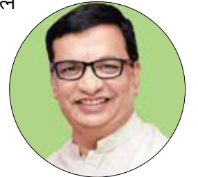
बाळासाहेब थोरात महसूल मंत्री

राज्यातील कोरोना रुग्णवाढ लवकरात लवकर आटोक्यात आणण्यासाठी उपाययोजनांची कठोर अंमलबजावणी तसेच सामूहिक प्रयत्न करण्याची गरज असल्याचे मत महसूल मंत्री बाळासाहेब थोरात यांनी व्यक्त केले. टाळेबंदी असूनही राज्यातील १५ जिल्ह्यांमध्ये कोरोनाची साथ आटोक्यात येत नसल्याच्या पार्श्वभूमीवर महसूल मंत्री श्री. थोरात यांच्या अध्यक्षतेखाली दूरदृश्य प्रणालीद्वारे ही बैठक झाली. या वेळी त्यांनी राज्यातील कोरोनास्थितीचा आढावा घेतला. बैठकीस आरोग्यमंत्री राजेश टोपे, वैद्यकीय शिक्षण व सांस्कृतिक कार्यमंत्री अमित देशमुख आदी या वेळी उपस्थित होते. राज्यातील बुलडाणा, कोल्हापूर, रत्नागिरी, सांगली, यवतमाळ, अमरावती, सिंधुदुर्ग, सोलापूर, अकोला, सातारा, वाशिम, बीड, गडचिरोली, अहमदनगर, उस्मानाबाद या १५ जिल्ह्यांमध्ये अजूनही मृत्युदर अधिक असून तो कसा कमी करता येईल, याबाबत तातडीने उपाययोजना करण्याचे निर्देश संबंधित जिल्हाधिकार्यांना या वेळी देण्यात आले.