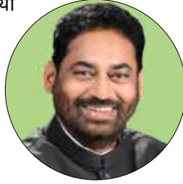
डॉ. नितीन राऊत ऊर्जा मंत्री

यासंदर्भात माहिती देताना मंत्री प्रा. गायकवाड म्हणाल्या, कोरोनामुळे उद्भवलेल्या असामान्य परिस्थितीत सर्वसमावेशक असे धोरण तयार करताना विभागातील तज्ज्ञ, मुख्याध्यापक, शिक्षक, लोकप्रतिनिधी, पालक संघटना, तंत्रज्ञान कंपन्या यांच्याशी सुमारे २४ बैठकांद्वारे चर्चा केली आहे. सर्व घटकांशी सखोल चर्चा करून इयत्ता दहावीच्या विद्यार्थ्यांना गुणदान करण्याबाबतचे धोरण निश्चित