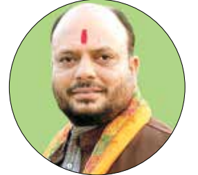
गुलाबराव पाटील पाणी पुरवठा व स्वच्छता मंत्री

महाराष्ट्र जीवन प्राधिकरणाच्या मालकीच्या नागरी, ग्रामीण पाणीपुरवठा योजना, डोंगराळ/पर्यटन क्षेत्रातील पाणीपुरवठा योजना व पेरी अर्बन योजनांमधून होणाऱ्या पाणीपुरवठ्याच्या दराचा आढावा या बैठकीत घेण्यात आला तसेच सुधारित दरांना मंजुरी देण्यात आली.