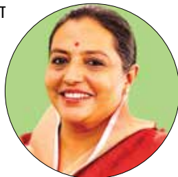
अॅड. यशोमती ठाकूर महिला व बालविकास मंत्री

कोरोना कालावधीत माता-पिता बळी पडल्यामुळे अनाथ झालेल्या बालकांच्या पुनर्वसनासाठीचे प्रयत्न गतिमान करावेत, यासाठी अशा संकटग्रस्त बालकांपर्यंत पोहोचण्याची यंत्रणा प्रभावी करावी; घरगुती हिंसाचार आणि कामाच्या ठिकाणी लैंगिक शोषणाला बळी पडलेल्या महिलांना न्याय मिळवून देणे तसेच अशा घटनांना प्रतिबंध करण्यासाठी उपाययोजना कराव्यात; संकटग्रस्त महिला व बालकांना समुपदेशन उपलब्ध करून द्यावे, आदी निर्देश