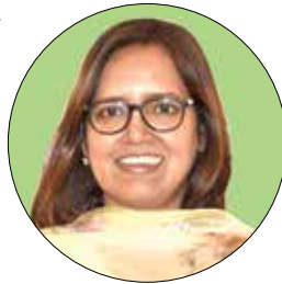
प्रा. वर्षा गायकवाड शालेय शिक्षण मंत्री

देशभरात तळागाळांतील क्रीडा पायाभूत सुविधा उपलब्ध व्हाव्यात, यासाठी राज्य सरकारच्या सहकार्याने क्रीडा मंत्रालयामार्फत खेलो इंडिया सेंटर्स सुरू करण्यात येत आहेत, त्यानुसार देशातील प्रत्येक जिल्ह्यात किमान एक खेलो इंडिया सेंटर मान्य करण्यात येणार आहे, सर्व राज्ये आणि केंद्रशासित प्रदेशांमध्ये १००० खेलो इंडिया सेंटर उघडण्याच्या क्रीडा मंत्रालयाच्या या मोठ्या योजनेत महाराष्ट्रामध्ये सर्व ३६ जिल्ह्यांमध्ये खेलो इंडिया सेंटर स्थापित करण्याचा निर्णय घेतला आहे. यासाठी केंद्र शासनाकडून ३.६० कोटी रुपये इतके अर्थसाहाय्य प्राप्त होणार आहे, अशी माहिती श्री. केदार यांनी दिली.