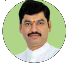
धनंजय मुंडे सामाजिक न्याय व विशेष साहाय्य मंत्री

राज्य शासनाच्या सेवेतील दिव्यांग अधिकारी-कर्मचाऱ्यांना कार्यालयात उपस्थित राहण्यापासून सूट देण्याचा तसेच 'वर्क फ्रॉम होम'ची मुभा देण्याचा निर्णयही श्री. मुंडे यांच्या निर्देशानुसार घेण्यात आला आहे.