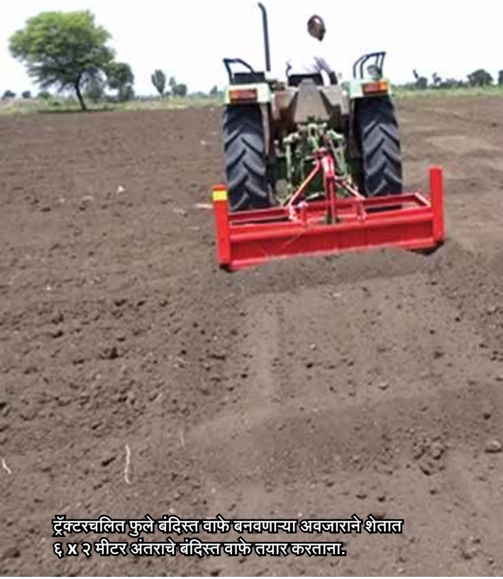
ट्रॅक्टरचलित फुले बंदिस्त वाफे बनवणाऱ्या अवजाराने शेतात ६ X २ मीटर अंतराचे बंदिस्त वाफे तयार करताना.

पाणी वाहून जात नाही. तसेच पाण्याची व मातीची धूप रोखते, आर्द्रता वाचते आणि पिकाचे उत्पादन वाढते. जेव्हा पाऊस पडतो तेव्हा शेतजमिनीच्या पृष्ठभागावर पडणारे पावसाचे पाणी वाहून न जाता तयार केलेल्या बंदिस्त वाफ्यामध्ये पाणी अडवले जाते आणि जमिनीत मुरवण्यास मदत होते.