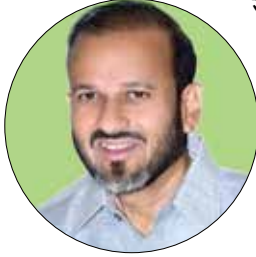
अॅड. के. सी. पाडवी आदिवासी विकास मंत्री

गडचिरोली जिल्ह्यातील आदिवासी कुटुंबाचे राहणीमान व जीवनमान उंचावण्यासाठी मानव विकास कार्यक्रमांतर्गत 'मोहफूल - आदिवासी उपजीविकेचे एक साधन' हा प्रकल्प राबवण्यास राज्य शासनाने मंजूरी दिली आहे. गडचिरोली जिल्ह्यातील वन धन केंद्रामार्फत शबरी आदिवासी वित्त व विकास महामंडळ हा प्रकल्प राबवणार आहे. आदिवासी कुटुंबाचे सशक्तीकरण व्हावे आणि ते आर्थिकदृष्ट्या सक्षम व्हावे यासाठी हा प्रकल्प राबवण्यासाठी आदिवासी विकास मंत्री अॅड. के.सी. पाडवी यांनी पाठपुरावा केला होता.