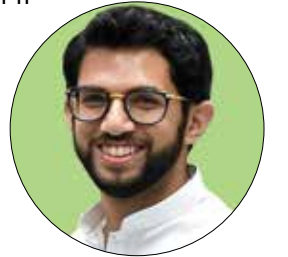
आदित्य ठाकरे पर्यटन, पर्यावरण व वातावरणीय बदल मंत्री

दरवर्षी लाखो नागरिक या स्थळाला भेट देतात. त्यांना सुंदर जागा उपलब्ध व्हावी असा प्रयत्न आहे, असे मंत्री श्री. ठाकरे यांनी सांगितले.