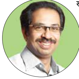
उद्धव बाळासाहेब ठाकरे मुख्यमंत्री

येणाऱ्या पावसाळ्यात नैसर्गिक आपत्तींचा अंदाज घेऊन सर्व यंत्रणांनी समन्वयाने व काळजीपूर्वक काम करावे तसेच नागरिकांना वेळीच सूचना मिळतील याची काळजी घ्यावी, असे मुख्यमंत्री उद्धव ठाकरे यांनी कोकण विभागातील सर्व जिल्ह्यांचा पावसाळ्यापूर्वीच्या तयारीचा आढावा दूरदृश्य प्रणालीद्वारे घेतला, त्यावेळी ते बोलत होते. या वेळी कोकणातील जिल्ह्यांचे जिल्हाधिकारी, तटरक्षक दल, मत्स्यव्यवसाय विभाग, हवामान विभाग, नौदल यांनी बैठकीत आपापल्या तयारीची माहिती दिली.