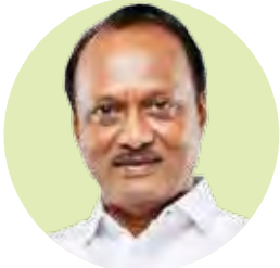
अजित पवार उपमुख्यमंत्री

कोयना धरण प्रकल्पग्रस्तांच्या अद्ययावत संकलन यादीचे बहुतांश काम पूर्ण झाले असून महाराष्ट्र दिनापासून पात्र प्रकल्पग्रस्तांच्या जमीन वाटपाच्या प्रक्रियेला सुरुवात करण्यात येणार आहे. कोयना धरणाच्या वर्धापनदिनी प्रातिनिधिक स्वरूपात प्रलंबित पात्र प्रकल्पग्रस्तांना जमिनीचे प्रत्यक्ष वाटप करण्याचा निर्णय उपमुख्यमंत्री अजित पवार यांच्या अध्यक्षतेखाली झालेल्या बैठकीत घेण्यात आला. कोयना धरण प्रकल्पग्रस्तांच्या पुनर्वसनासह त्यांचे प्रलंबित प्रश्न तातडीने मार्गी लावण्याची कार्यवाही करण्याचे निर्देश उपमुख्यमंत्री अजित पवार यांनी या वेळी दिले.