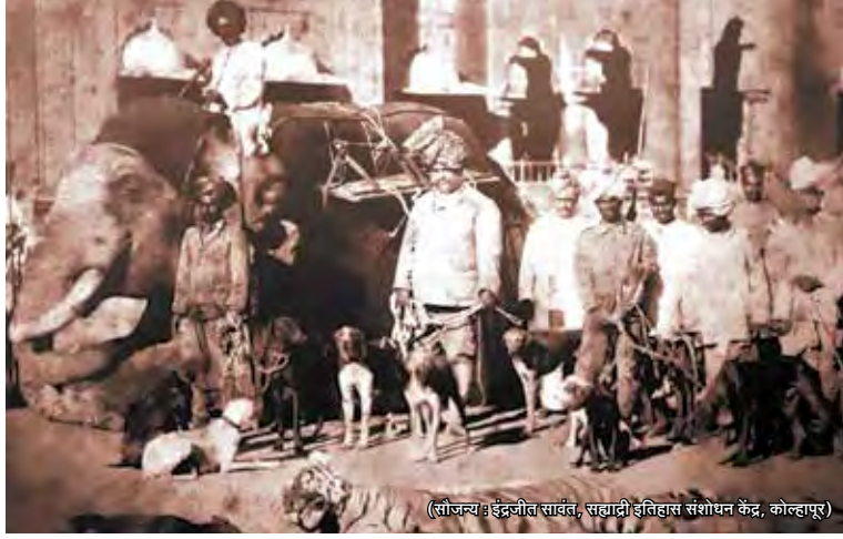
पट्टेदार वाघाची शिकार करणाऱ्या आपल्या श्वानांसोबत राजर्षी शाहू महाराज.

देशाच्या स्वातंत्र्यासाठी ज्यांनी ब्रिटिशांविरुद्ध आंदोलन करून स्वातंत्र्य पैदा केले, त्यांनाच राष्ट्रपुरुष म्हणणे अथवा त्यांनीच आपल्या राष्ट्राची जडणघडण केली, असे म्हणणे म्हणजे इतिहासाचे मोठे अज्ञान ठरेल. देशाच्या स्वातंत्र्यासाठी जे लढले ते राष्ट्रपुरुष खरेच, पण जे देशातील ९५ टक्के मागासलेल्या समाजाच्या उद्धारासाठी खपले, त्यांच्या सामाजिक समतेच्या व न्यायाच्या हक्कांसाठी लढले, ते राष्ट्रपुरुष