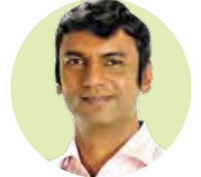
शंकरराव गडाख मृदू व जलसंधारण मंत्री

मृदू व जलसंधारण विभागामार्फत कोकण, पुणे, नाशिक, औरंगाबाद, अमरावती आणि नागपूर मंडळांतर्गत सर्व जिल्ह्यातील मुख्यमंत्री जलसंवर्धन कार्यक्रम, राज्यस्तर योजना, जिल्हा नियोजन समिती व महाराष्ट्र जलसंधारण महामंडळ अंतर्गत ० ते ६०० हेक्टर सिंचनक्षमतेच्या सर्व योजनांचा आढावा मृदू व जलसंधारण मंत्री