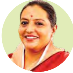
अॅड. यशोमती ठाकूर महिला व बालविकास मंत्री

‘सुपोषित भारत’ या संकल्पनेखाली आता पोषणाची चळवळ सर्वत्र पसरू लागली आहे. या चळवळीत महाराष्ट्राने सातत्याने अग्रेसर राहत आपले अव्वल स्थान कायम राखले आहे. नुकत्याच झालेल्या पोषण पंधरवड्यात महाराष्ट्र राज्याने देशात पुन्हा एकदा पहिला क्रमांक पटकावला आहे. राष्ट्रीय पातळीवर घेण्यात आलेल्या कार्यक्रमांची संख्या व सहभागी