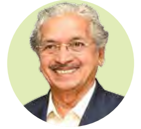
सुभाष देसाई उद्योग, खनिकर्म, मराठी भाषा मंत्री

या वेळी श्री. देसाई म्हणाले की, मराठी भाषा विभागाने मागील दोन वर्षात अनेक चांगले उपक्रम राबवले. मराठी भाषेचे संवर्धन अधिक चांगल्या प्रकारे कसे करता येईल, यासाठी विशेष प्रयत्न केले. यामध्ये सर्व भाषांच्या शाळांमध्ये मराठीची सक्ती, दुकानांवरील मराठी भाषेतील पाट्यांचा कायदा केला. याशिवाय स्थानिक स्वराज्य संस्थांच्या कामकाजात मराठीचा वापर प्रभावीपणे व्हावा, यासाठी देखील कायदा केला. आगामी काळात दैनंदिन कामकाजात मराठी भाषेचा वापर वाढवण्यासाठी सर्व नगरपालिका आणि महामंडळ प्राधिकरणात कार्यशाळा घेतली जाईल. याशिवाय दुकानांच्या पाट्यांचे निरीक्षण करण्यासाठी सर्वसामान्य नागरिकांनी पुढाकार घ्यावा, असे आवाहन श्री. देसाई यांनी केले.