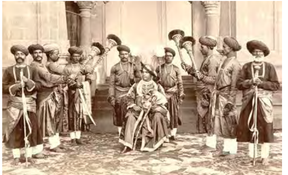
राजर्षी छत्रपती शाहू महाराजांचे राज्यारोहण समारंभाचे छायाचित्र.

आपल्या अफाट शक्तिसामर्थ्यामुळे शाहू महाराज त्या काळात आणि आजही दंतकथा बनून राहिले आहेत. ऐन ज्वानीत कोल्हापूर-महाबळेश्वर हे अंतर एका दमात घोडेस्वारीने काटणारे महाराज, भरधाव मोटार आपल्या अंगातील रगीने रोखून धरणारे महाराज, पागेला आग लागली तेव्हा मजबूत घोडी खांद्यावर घेऊन त्यांना आगीतून बाहेर काढणारे महाराज, खवळलेल्या वाघावर निःशस्त्र चाल करून केवळ त्याचा गळा घोटून ठार मारणारे महाराज, कुस्तीच्या आखाड्यात पैलवान नाठाळपणा करून लागले, तर त्यांच्या जांघेत हात घालून त्यांना अलगद उचलून बाजूला ठेवणारे महाराज, क्लोरोफॉर्म न घेताच दीड-दोन तासांचे टॉन्सिलचे ऑपरेशन डॉक्टरकडून करवून घेणारे महाराज, अशा महाराजांच्या अचाट शक्तीच्या कथा त्यांच्या चरित्रातही नोंदल्या गेल्या आहेत. महाराजांच्या या कृत्यांनी