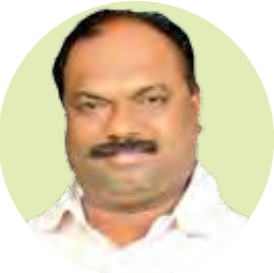
अॅड. अनिल परब परिवहन मंत्री

ठाणे शहरातील कळवा रुग्णालयाजवळील एसटी कार्यशाळेच्या जागेवर पालिकेचे सुपरस्पेशालिटी रुग्णालय उभे करण्यास तसेच ठाणे रेल्वे स्थानकाजवळील एसटी स्थानकाची जागा भूमिगत वाहनतळासाठी देण्यास परिवहन विभागाने अखेर मंजुरी दिली आहे. त्यामुळे लवकरच या दोन्ही जागा ठाणे महानगरपालिकेला हस्तांतरित होण्याचा मार्ग मोकळा झाला आहे. नगरविकास मंत्री एकनाथ शिंदे आणि परिवहन मंत्री अॅड. अनिल परब यांच्यामध्ये मंत्रालयात झालेल्या बैठकीत हा निर्णय घेण्यात आला आहे.