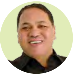
दिलीप वळसे-पाटील गृहमंत्री

सामान्यातील सामान्य माणसाला न्याय मिळवून देणे हे पोलिसांचे प्रमुख कर्तव्य आहे. जनतेच्या मनात पोलिसांबद्दल विश्वास निर्माण करण्याबरोबच सामाजिक सौहार्द टिकविण्यावर भर द्या, असे गृहमंत्री दिलीप