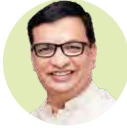
बाळासाहेब थोरात महसूल मंत्री

ई-पीक पाहणी संदर्भात माहिती घेताना येत्या खरीप हंगामात शेतकऱ्यांच्या पिकांची अचूक नोंद करण्यासंदर्भात राज्यव्यापी ई-पीक पाहणी प्रकल्पाची प्रभावी अंमलबजावणी होईल, याकडे प्रशासनाने कटाक्षाने लक्ष केंद्रित करावे, अशा सूचना श्री.थोरात यांनी या वेळी केल्या.