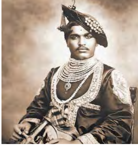
राजर्षी छत्रपती शाहू महाराजांचे राज्यारोहणावेळचे छायाचित्र.

शास्त्रे, तत्वज्ञान, राजनीती आदी प्रांतांतही त्यांनी मोठी प्रगती केली होती. पाश्चात्यांचे अनुकरण करून जपानी लोकांप्रमाणे आपण आपली सुधारणा केली पाहिजे, असे शाहू महाराजांना वाटे, पण असे करत असताना, आपल्या सांस्कृतिक परंपरांकडे पाठ करून पाश्चात्यांच्या संस्कृतीचे सरसकट अंधानुकरण करावे, असे त्यांना वाटत नसे. त्या काळी संस्थानिकांच्या मुलामुलींच्या शिक्षणासाठी युरोपियन