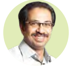
उद्धव बाळासाहेब ठाकरे मुख्यमंत्री